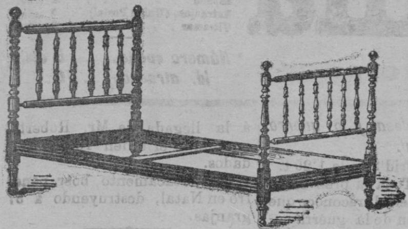
CAMA DE DOS CABECERAS CON SOMIER CLASE SUPERIOR CUARENTA PESETAS