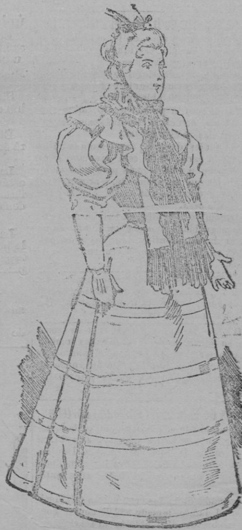
Traje de visita

Las mangas y los costados de esta chaqueta son de terciopelo color berengena lo mismo que los adornos.