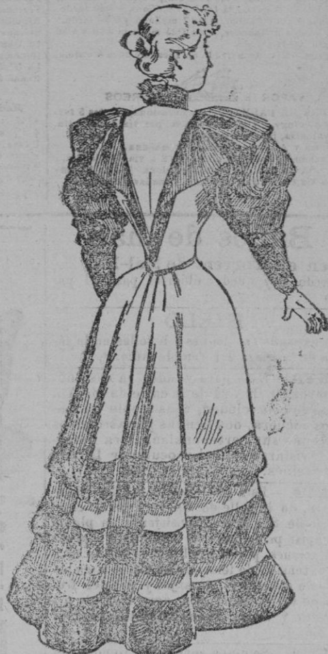
Vestido de recepción

El sombrero, es de los llamados platos , y se guarnece con un sprit y flores combinadas con los colores del vestido.