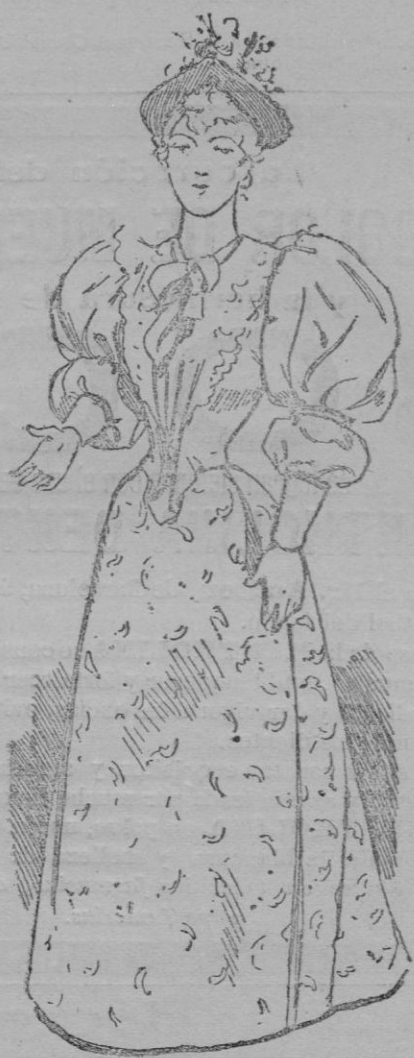
Traje de mañana

Y el cinturón es lo mismo que las demás guarniciones; de cinta ó encaje adornado con bordados bontons d'or .