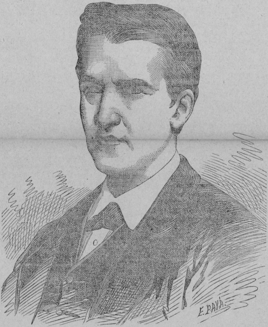
TOMÁS A. EDISON

La mayor parte de los inventores proceden de lo conocido á lo desconocido y buscan una so-