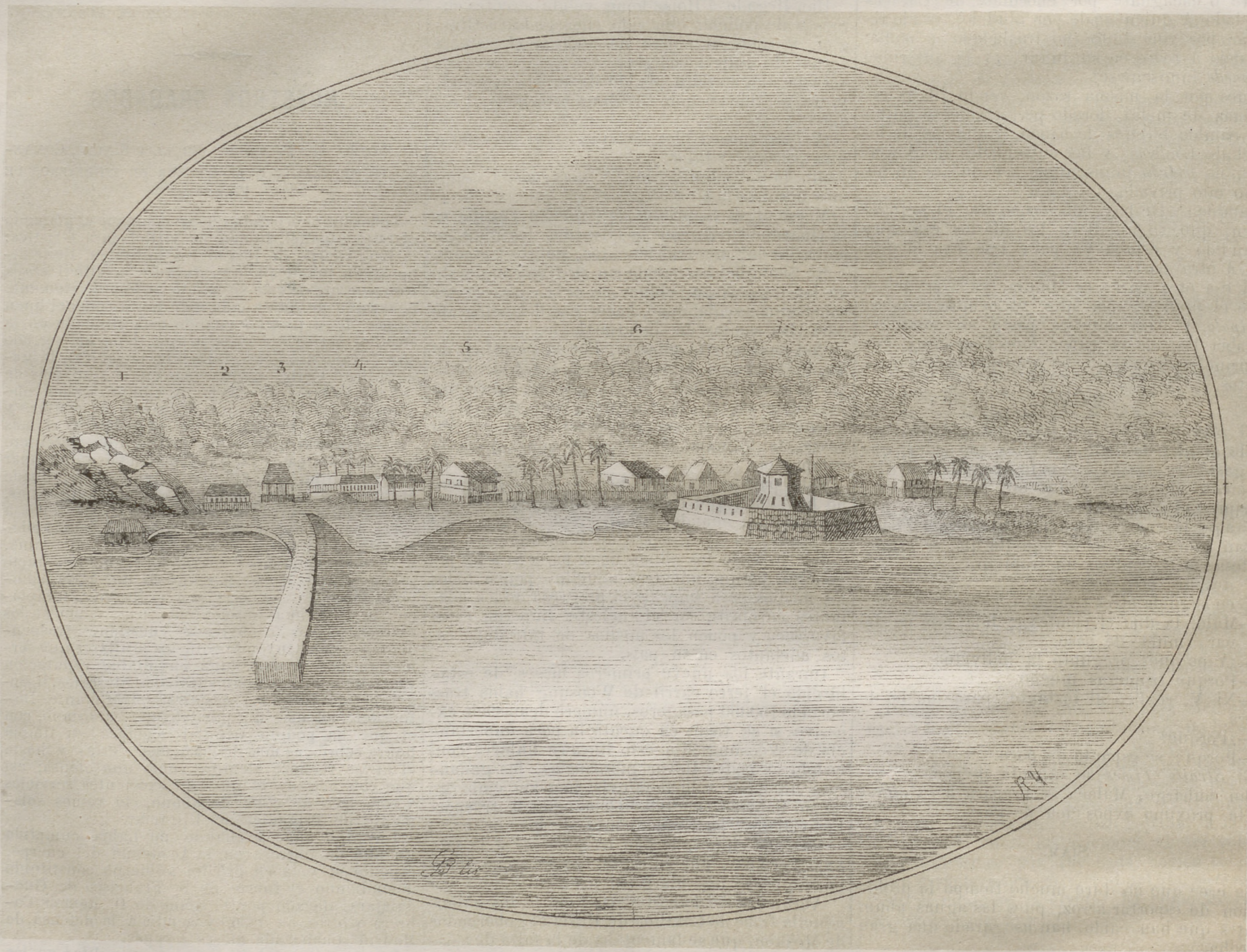
ESTABLECIMIENTO MILITAR DE BALABAC.