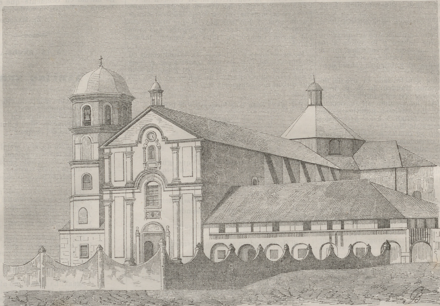
Iglesia parroquial de Lipa.