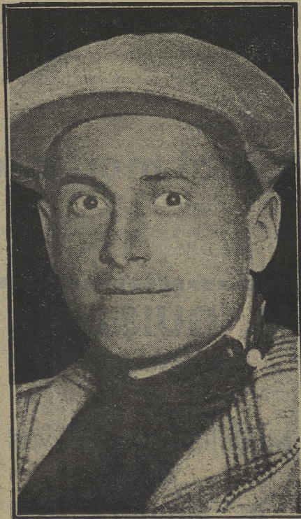
Binda, el "campionísimo" italiano, multado en el Congreso de la U. C. I.

El Irún apuradillo se vió, pero ganó al Sabadell; y el Murcia derrotó al Spórting por una diferencia que marca bien la forma de ambos