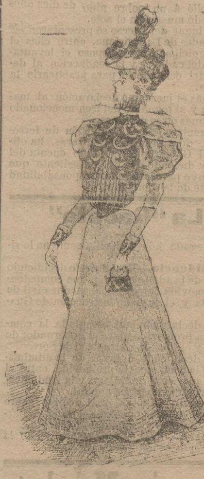
Traje de pasco. La falda y las mangas son de pañete fino, color rojo pompeyano.

El cuerpo es una blusa fruncida de surah negro con motitas rojas, sobre el cual va colocado un originalísimo bolero de terciopelo negro bordado con hilillo de oro.