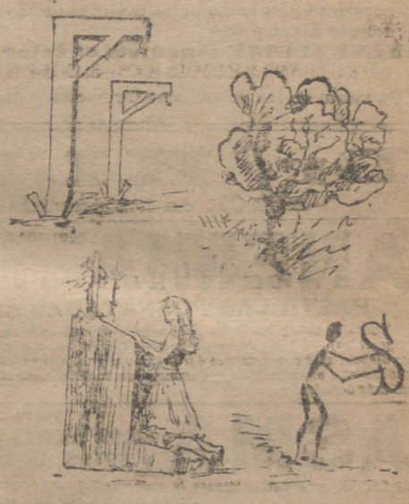
Solución al jeroglífico anterior: El tiro por la culata.