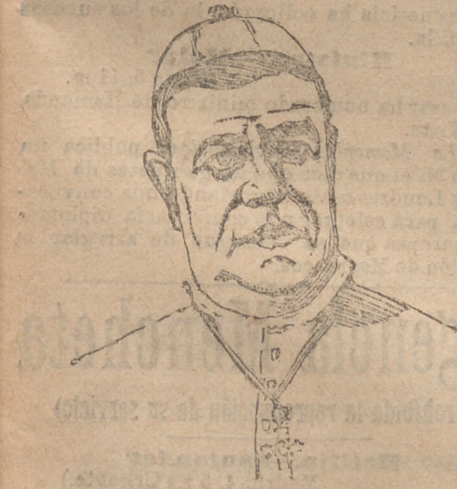
EL OBISPO DE TENERIFE

PASTORAL IMPORTANTE Lo es la que ha dirigido á sus diocesanos el sabio eusto virtuoso obispo de Santander. Dice así: VENERABLES HERMANOS Y AMADOS HIJOS: Bien sabéis que nuestras tropas de Melilla, por orden del general Margallo, gobernador de la plaza, al amparo de solemne pacto internacional se ocupaban el día 2 del mes que ya se acaba, en construir un fuerte de defensa en nuestro campo, cuando de improviso se vieron acometidas por numerosa turba de moros del Rif. Nuestros soldados se defendieron como valientes y no fueron vencidos; pero dejaron en el campo muchos cadáveres, que fueron horriblemente mutilados por los bárbaros musulmanes.