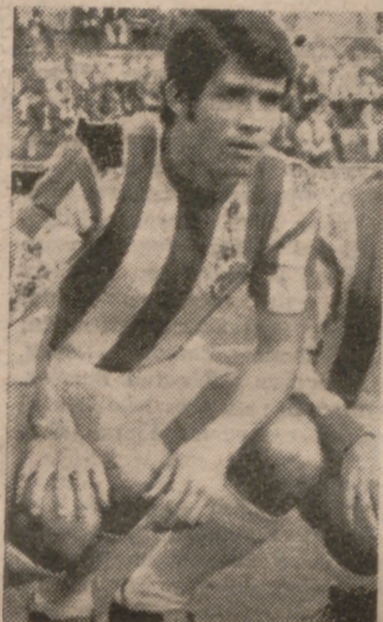
Alvarez parece tener sitio seguro en el equipo.

Lizarralde, en condiciones de reaparecer