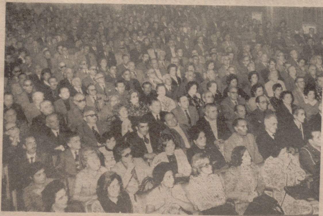
EL PUBLICO ABARROTABA EL LOCAL

Al final, un bosque de brazos en alto, mientras el millar largo de voces emocionadas entonaba el «Cara al Sol». Y después, a casa, todos, en seguida, porque había interés y ansiedad por conocer las últimas noticias referentes a la enfermedad de Franco.