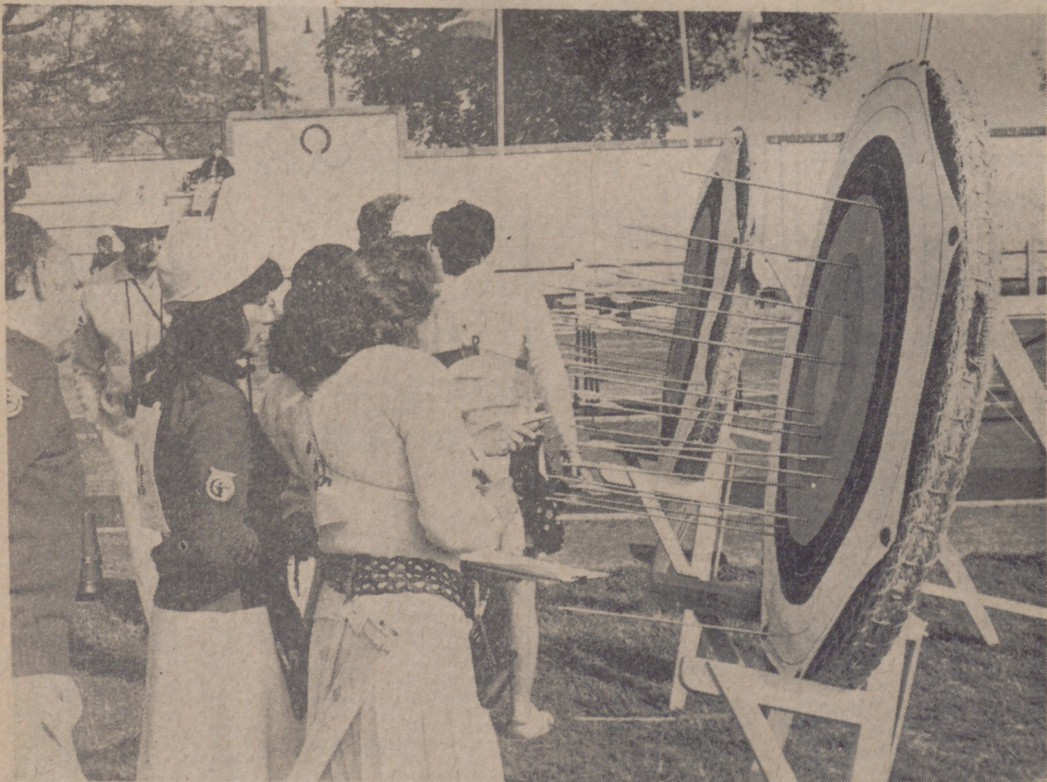
Ha concluido el lanzamiento de las flechas reglamentarias. Los participantes y los jurados van hacia las dianas para efectuar el recuento de puntos. Es el momento de saber si el pulso se mantuvo firme, si no falló la vista, si los nervios no traicionaron a las intenciones de éxito. Hay algunos dardos en el centro, otros se han desviado un poco, pero aún hay tiempo de enmendar posibles errores.