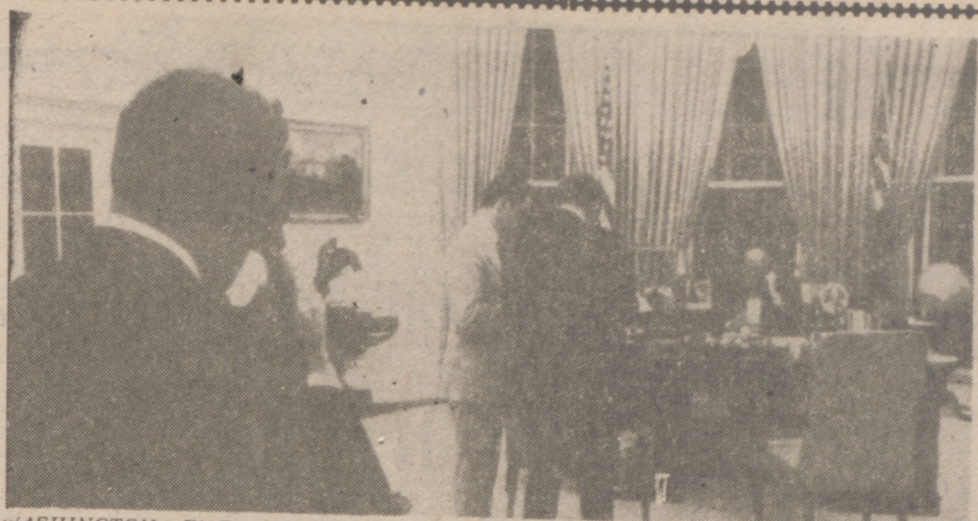
WASHINGTON.—El Presidente Ford obtiene, por teléfono, información del Secretario de Defensa, James Schlesinger, sobre la situación del mercante «Mayaguez», poco antes de que el barco fuese recuperado. El Secretario de Estado, Henry Kissinger (izquierda) escucha en una extensión telefónica.