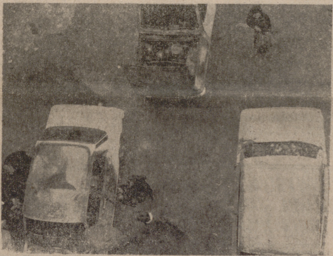
Estado en que quedaron los vehículos siniestrados esta madrugada, suceso del que ofrecemos amplia información en cuarta página.

Los coches siniestrados pertenecen a empleados de FASA-RENAULT