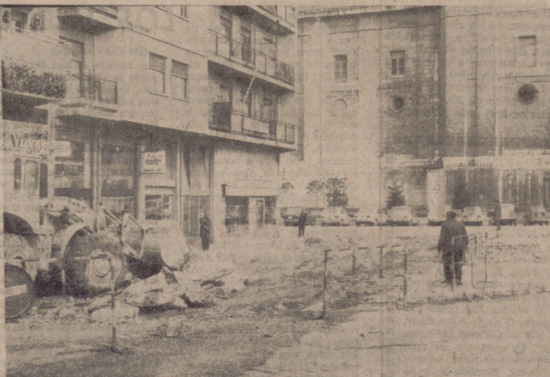
La Plaza de Onésimo Redondo, pequeña y recóleta, fue en sus tiempos eso: una plaza, una isleta de zona verde, con sus jardincillos, sus bancos para sentarse, no de los otros, e incluso una fuente. Pero últimamente la Plaza de Onésimo Redondo se había convertido en un frío y pequeño aparcamiento, que si resolvía parte del problema que afecta en general a la ciudad, en ocasiones producía ciertos atascos que hacían, como se suele decir peor el remedio que la enfermedad. Ahora, al desaparecer el Mercado de Portugalé, al convertirse aquello en una amplia y magnífica zona ajardinada, ha desaparecido también la piqueta o, mejor dicho, el aparcamiento de Onésimo Redondo. La zona en obras, como se ve en la fotografía. Lo que no sabemos es en qué quedará aquello, si en un aparcamiento o en jardín, en zona verde, como se dice ahora. Hemos preguntado en el Ayuntamiento y no nos lo han dicho. Así que a esperar...