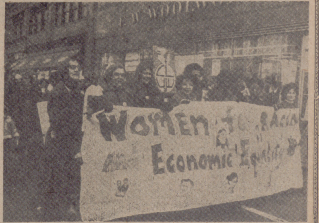
NUEVA YORK.—Con una gran pancarta que pide la igualdad racial y económica para las mujeres, un grupo de un total de dos mil mujeres que se manifestaron a través la Quinta Avenida, durante la marcha por el Día Internacional de la Mujer. Las manifestantes desean igualdad total de las mujeres con los hombres.