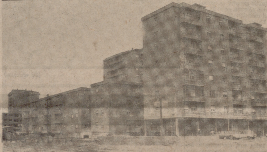
En la Huerta del Rey—la fotografía nos muestra un aspecto de la Avenida de Salamanca—se están realizando importantes obras de urbanización, por un importe de treinta y nueve millones de pesetas. Amplias zonas verdes, jardines, paseos, avenidas, farolas, bancos y plantación de árboles, son mejoras que saltan a la vista y que llenan de satisfacción a quienes viven o van a vivir en esta novísima zona residencial de nuestra ciudad y en general a todos los valladoleños. La Huerta del Rey, construida y planificada según criterios de nuestro tiempo, puede ser el punto de arranque de un Valladolid nuevo de cara al futuro, por lo que todo lo que se relacione con esta zona debe ser cuidado al máximo, sin dejar cabida a improvisaciones ni interferencias de ningún tipo. Con estas importantes obras la Huerta del Rey va a adquirir pronto su auténtica y magnífica fisonomía, que debe conservarse.