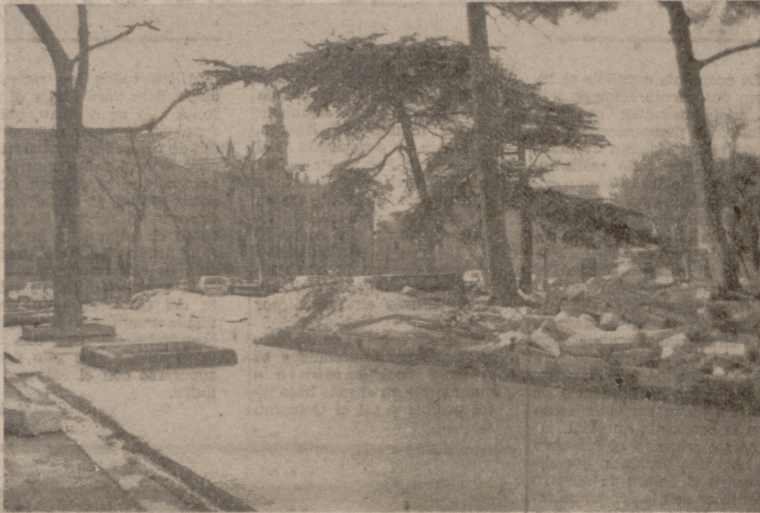
La ciudad está en obras y eso es buen sintoma siempre que se realicen con acertado criterio. Sabemos que es una incomodidad, que es una molestia, pero la necesidad de renovarse es ineludible. Hay que hacerlo. Ahora, y entre otras zonas próximas, también se encuentra en obras la Plaza de la Universidad, importante centro urbano, en el que se están llevando a cabo amplias y diversas mejoras que afectan tanto a la misma plaza como a las zonas aledañas. Esperamos y deseamos que sea para bien, que falta hace, porque es el lugar de los más congestionados de la ciudad a cualquier hora tanto para el viandante como para el conductor.