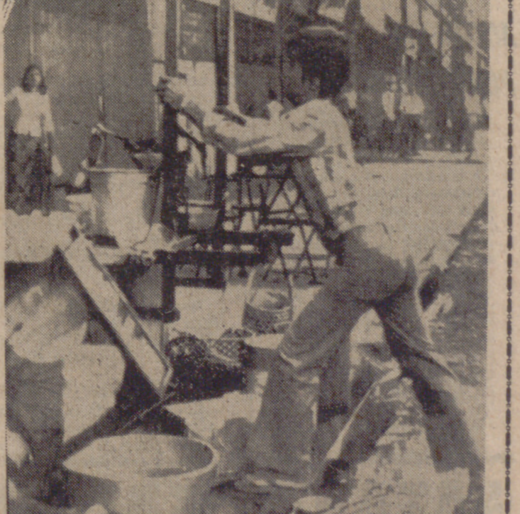
PHNOM PENH (Camboya).—Un estudiante camboyano trata de derribar un quiosco de alimentos propiedad de un chino en una acera del centro de la ciudad, durante los disturbios anti-chinos para protestar contra la elevación de precios y escasez de productos alimenticios.

PHNOM PENH, 3. (Efe).—Los comunistas han vuelto a bombardear ayer esta ciudad y su aeropuerto de Pochentong, en los que cayeron 16 cohetes que han causado trece muertos y dieciocho heridos. El "puente aéreo" norteamericano ha iniciado hoy su quinto día de envío de suministros a la capital. Por su parte, la aviación camboyana ha seguido castigando las concentraciones de tropas y posiciones militares de los comunistas. El Presidente de Camboya, Lon Nol, anunció a una comisión de congresistas norteamericanos que visitaron el país que está dispuesto a dimitir con el fin de que se restablezca la paz en la nación. Al mismo tiempo solicitó la concesión de una nueva ayuda militar norteamericana de 222 millones de dólares.