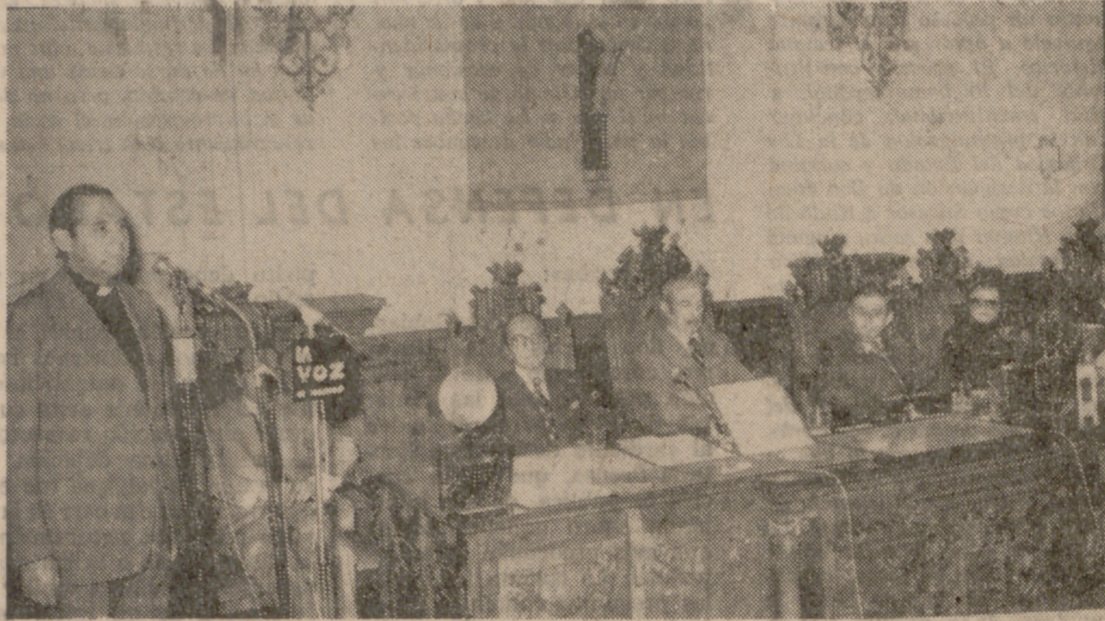
Presidencia del acto de entrega de premios de la II Bienal del Sonido. El Director de la Bienal dirige la palabra a los asistentes.

En la mañana del sábado se procedió a la entrega de los premios otorgados por los jurados del «Mirófono de oro de RIVE», por un lado, y del resto de las concesiones, por el otro. El acto tuvo lugar en el Ayuntamiento.