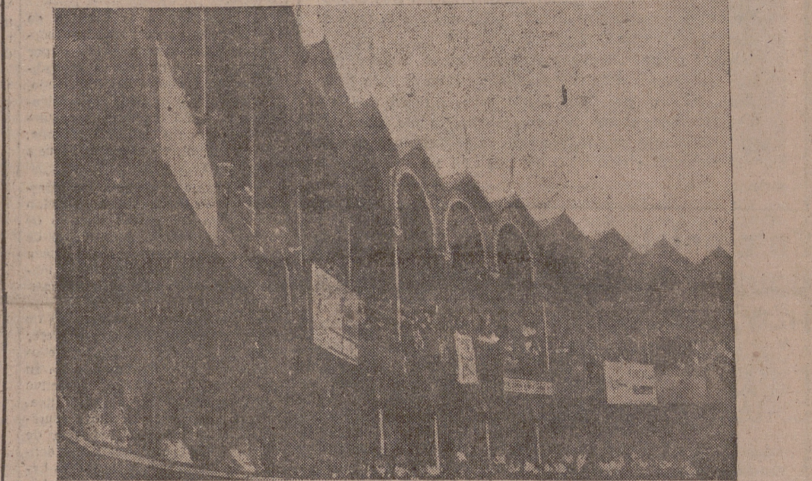
Bilbao, 5.—La Plaza de Toros de Vista Alegre ha desaparecido a consecuencia de un incendio que se declaró esta madrugada.

Unas seis horas después de que el caso registrara uno de los llenos más impresionantes de su historia, un pavoroso incendio ha