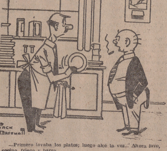
—Primero lavaba los platos; luego alcé la voz... Ahora javo, cocino, friego y barro,