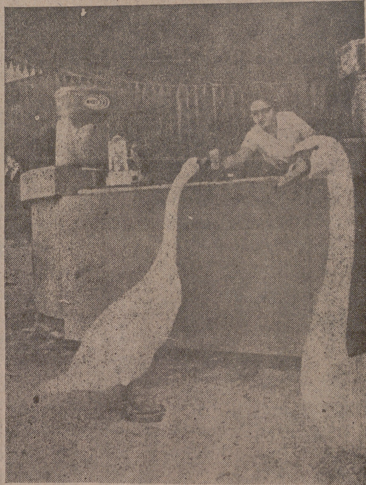
No es corriente por esas "barras" de Dios que se presenten clientes tan extraños. ¿Qué pedirán a la joven camarera? ¿Refrescos? ¿Helados? Todo es posible; pero lo que no nos explicamos es el género de moneda empleado para abonar la consumición. A no ser que... invítase la "casa".