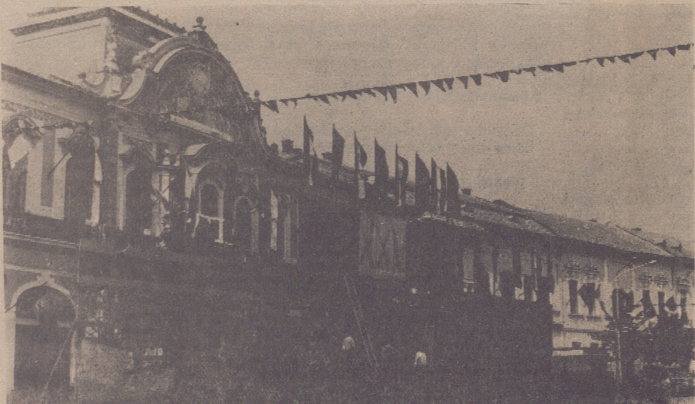
El centro de Bucarest, con la habitual falta de vehículos que se observa en las capitales del Este europeo.