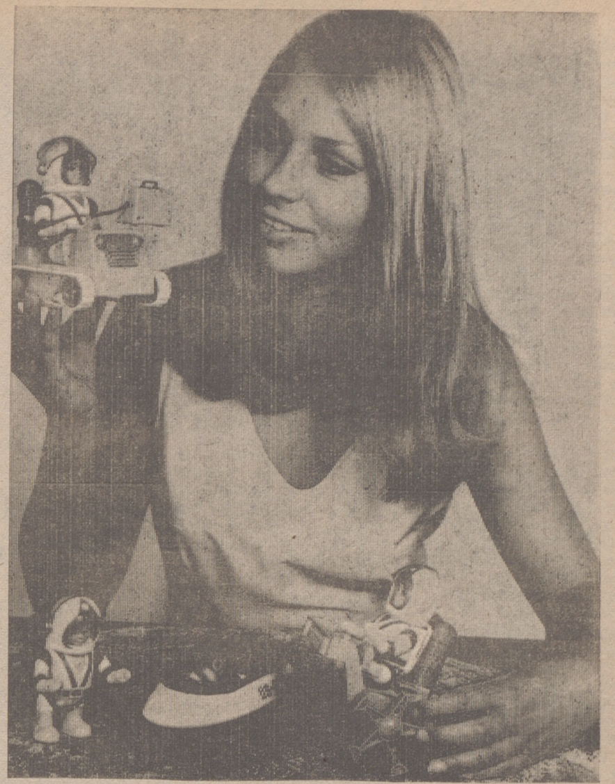
NUREMBERG (DaD). — La rubia señorita desempeña el papel de la «Señora Luna», dando la bienvenida a su primer visitante en miniatura. A tiempo para el negocio de Navidad, una fábrica en la República Federal de Alemania lanzó al mercado el primer lunanauta con traje espacial y mochila con batería. Cabe en cada uno de los tres vehículos que forman parte del juguete de siete piezas. La «raña para cráteres» supera fácilmente cualesquier obstáculo; la oruga y el trineo de equipaje sirven para el transporte de cargas «pesadas». Los constructores hasta pensaron en una pistola lanzabombas y en un ojo de radar. Puede considerarse como salido bien el alumnaje en el cuarto de los niños.

"Una balanza de pagos fuerte es crucial para nuestra economía. Sin ésta, el Gobierno y la industria no pueden planear con seguridad el crecimiento económico que se necesita para aumentar el nivel de vida", añadió el canciller del Tesoro.