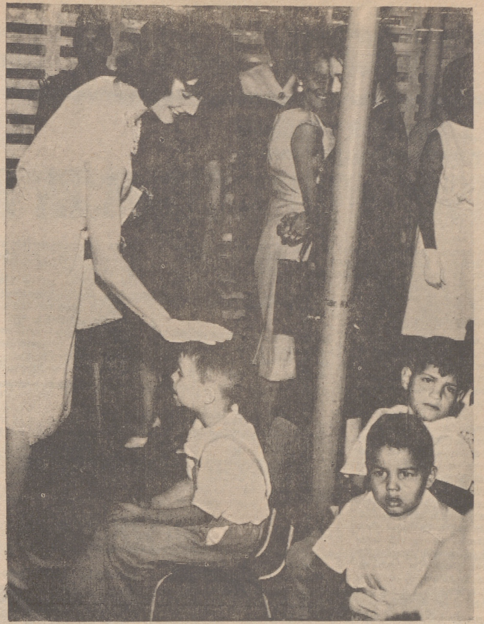
Jacqueline, ahora esposa de Onassis, que habla con fluidez el castellano, colaboró con su marido John en el acercamiento a Hispanoamérica. Aquí la vemos en Caracas visitando un jardín de infancia.

Se cumple ahora un año desde que, el 3 de octubre de 1968, el general Juan Ve-