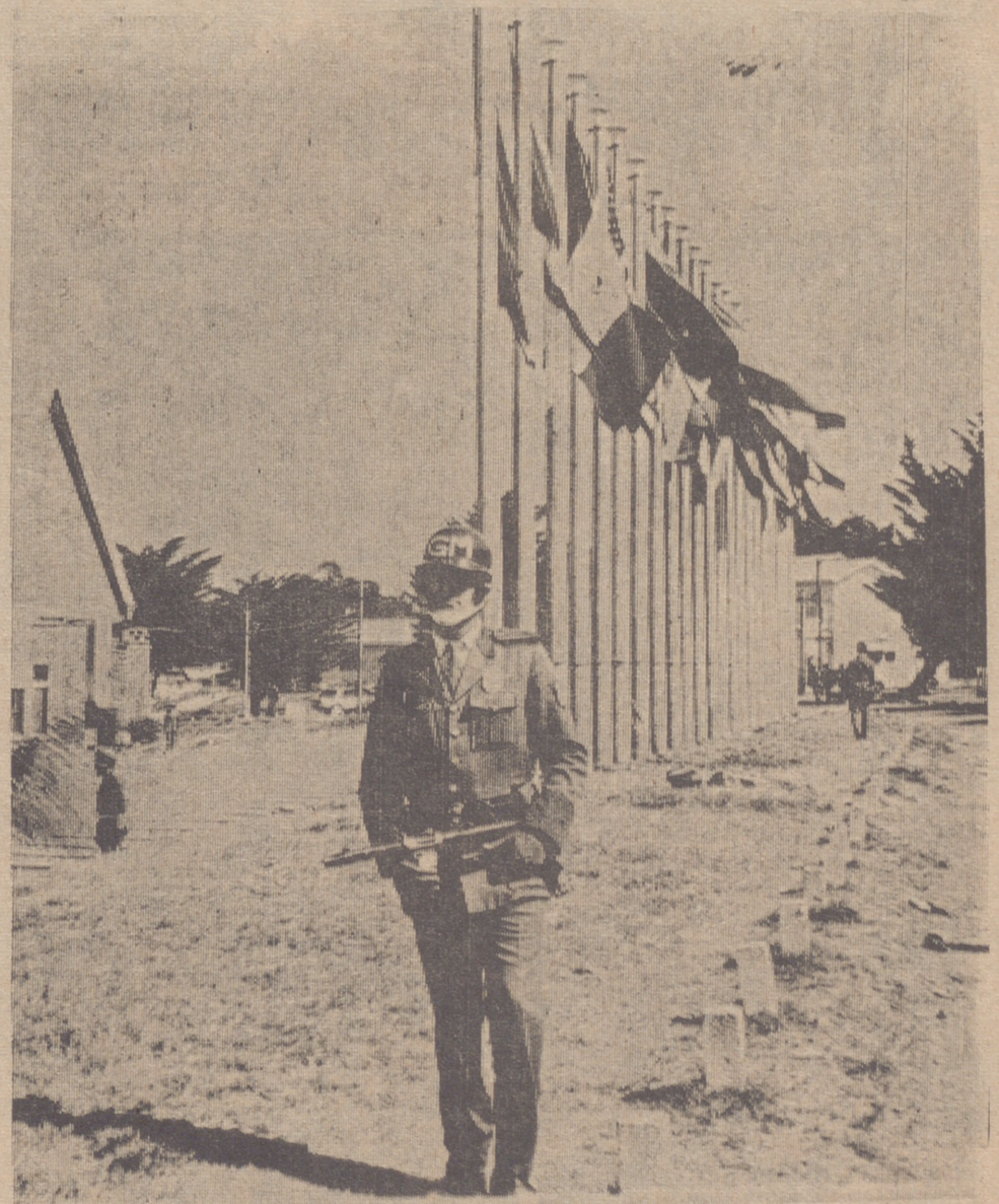
Siempre hubo temores en las reuniones panamericanas. Este soldado de la Guardia Nacional paraguaya vigila la entrada al lugar donde se celebró en Punta del Este la reunión que dio nacimiento a la "Alianza para el Progreso.