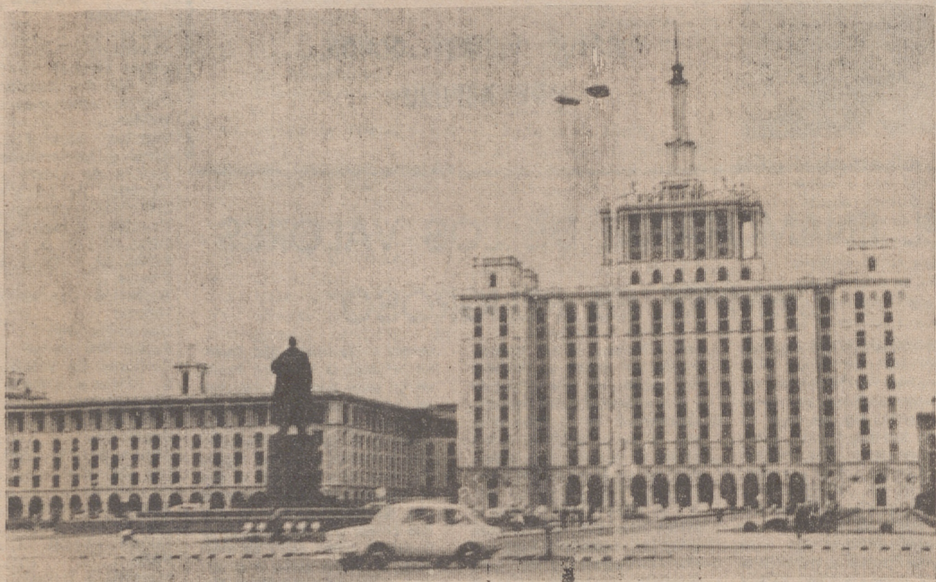
Tribunas, banderas y gallardetes son preparados en Rumanía como marco de las celebraciones del 25 aniversario de la Revolución.

Rumanía edifica hoteles, "bungalows", restaurantes y carreteras para atraer a los turistas. En realidad, Rumanía, se limita a acondicionar lo que podríamos denominar su infraestructura turística para que sea más fácil trasladarse a vivir a orillas del mar Negro, mar de unas playas impresionantes por la finura de su arena y por su sol,