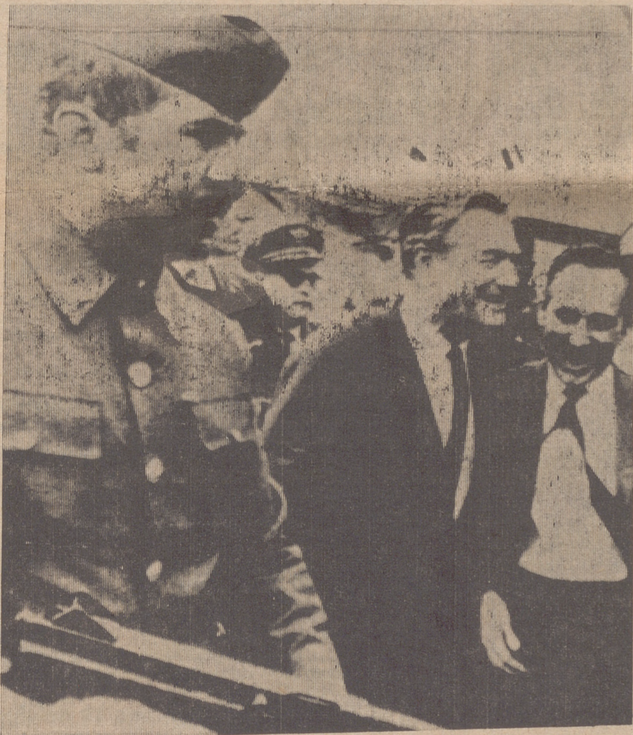
Nelson Rockefeller, el gobernador de Nueva York y enviado especial de Nixon, celosamente protegido contra los grupos hispanoamericanos.

de nivel de vida entre los norteamericanos y los hispanoamericanos, muchas veces imputable a la presión económica y al dominio de grandes compañías por el capital yanqui.