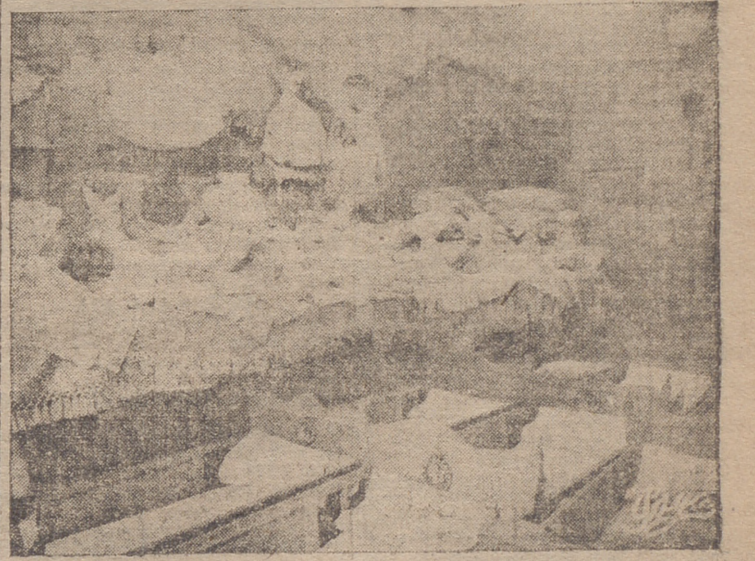
Aspecto de la primera exposición de canastillas inaugurada anteayer por la Sección Femenina de F. E. T. y de las J. O. N. S. (Información en segunda página)