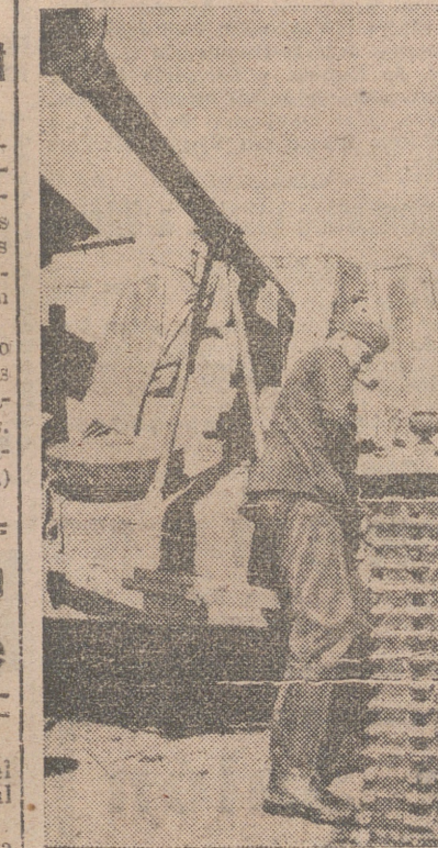
Los modernos tanques alemanes están construidos de modo que muchas de las más frecuentes averías pueden ser reparadas con gran rapidez. Aquí vemos a dos soldados cambiando un estalón deteriorado.