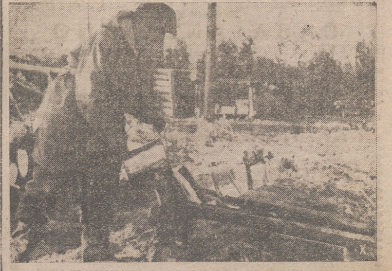
A todas horas se hace preciso reducir el agua en las trincheras. Una "capitalización" ingeniosa ayuda a resolver el problema, pero es necesario ayudar algo con un cántaro.