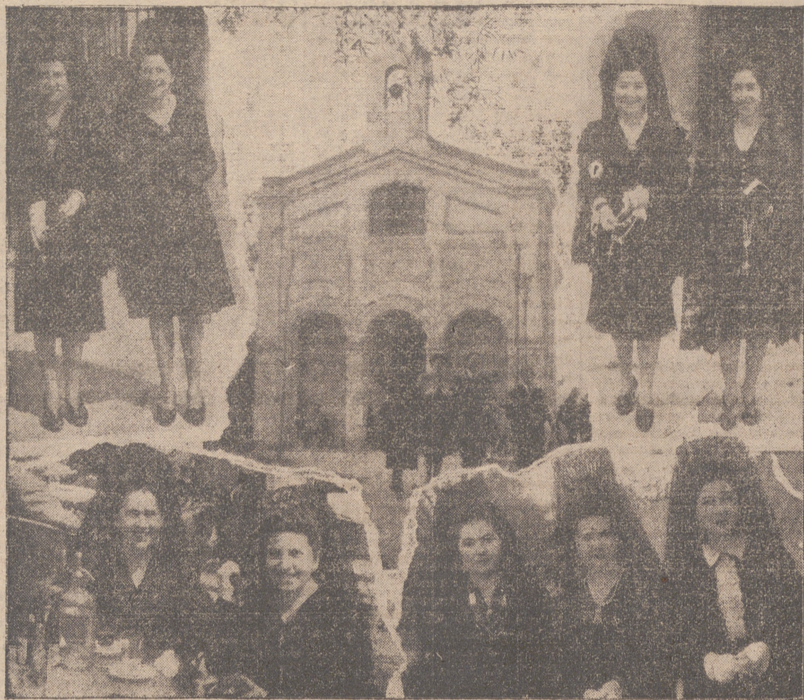
VARIAS NOTAS GRAFICAS DE JUEVES SANTO Y VISTA DE LA ERMITA DEL SANTO CRISTO DEL HUMILLADERO.