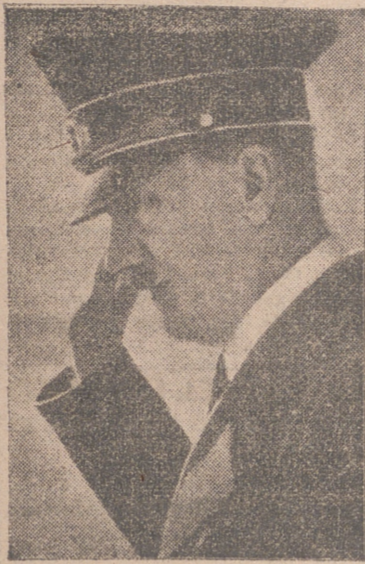
La potencia de la coalición mundial judía y la humanidad que lucha por su libertad, su existencia y su pan cotidiano obtendrá la victoria final.

El partido siempre ha estado animado por la firme voluntad de no capitular en ninguna circunstancia y de no cesar en el combate hasta que nuestros enemigos del interior hubieran sido vencidos y eliminados. Este fanatismo os lo he inspirado yo. Estad seguros de que todavía hoy me siento alentado por el mismo fanatismo que no me abandonará mientras tenga vida. También habéis tenido en mí, y lo he, de esto podrá estar igualmente convencidos, es hoy en mí más fuerte que nunca. Destruiremos