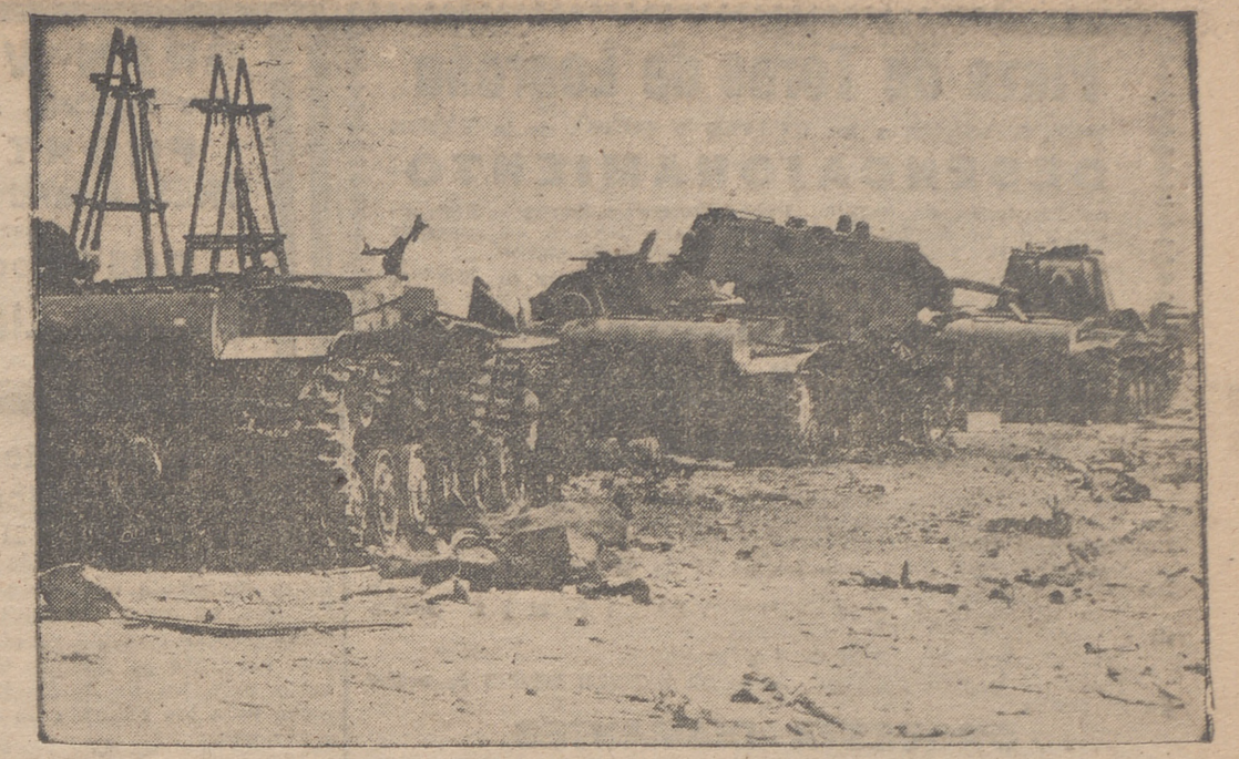
Estos tanques que ahora quedan totalmente destruidos, trataron de romper el frente alemán de Leningrado. Pero con este ataque de los soviéticos solamente se aumentó el número de sus tanques derrotados.