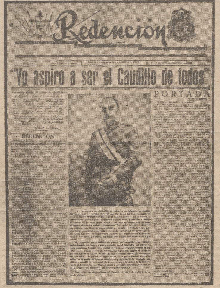
EL PRIMER NUMERO DEL PERIODICO "REDENCION"