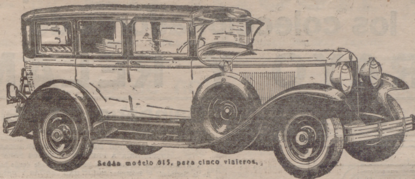
Modelo 615, para cinco viajeros.

CLASES DE FRANCES , por profesora acreditada, General Espartero, letra T, entresuelo, izqda. (frente al Servicio Doméstico).