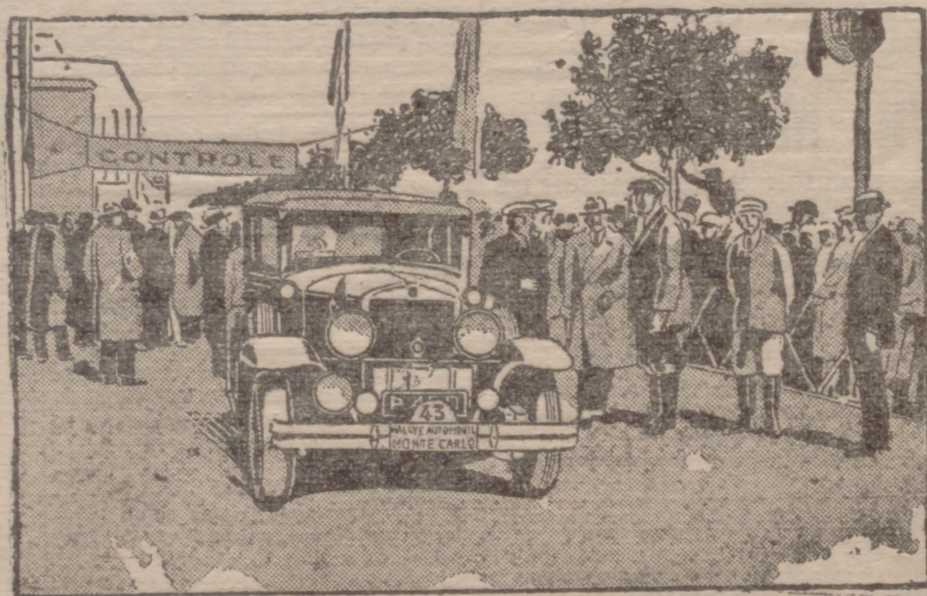
GRAHAM-PAIGE MODELO 629

Este concurso de Montecarlo (Estocolmo-Montecarlo) fué ganado con un Graham-Paige modelo 629