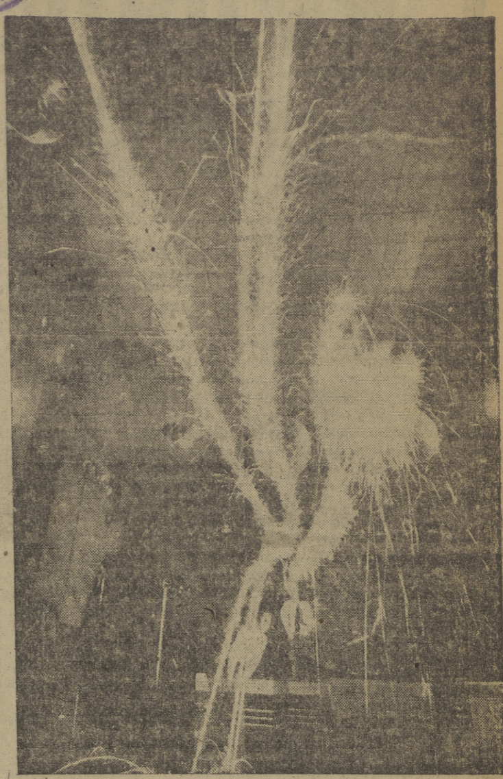
En el "Teatro atómico" de la Westinghouse, de los Estados Unidos, se han "disparado" proyectiles accionados por dióxido de carbono. Los proyectiles son disparados contra un globo representando un átomo de uranio 235, el tipo del empleado en las bombas atómicas. Los proyectiles sompán neutrones y, al golpear el balón, emiten "fragmentos atómicos" en forma de globos minúsculos. La fotografía recoge un interesante momento de los experimentos.