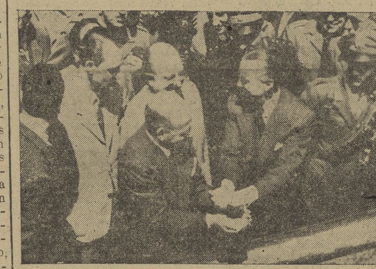
En el puerto de Nápoles, las autoridades yanquis entregan a las italianas un cargamento de trigo

Suceden cosas tan absurdas, itay que decir, en honor de la verdad, que Italia ha trabajado y trabaja lo suyo, sin atarse de paso a convencerse de que las manos con demasiados es-