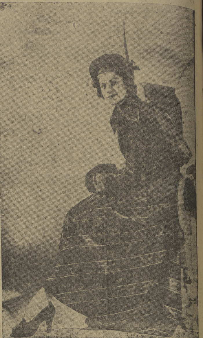
Vestido de taffeta "navy", en dos piezas, a rayas azules y rojas, con mangas de capa y amplio cuello, que en su exposición para 1949 presenta en Londres Brenner Sports.

NUEVA YORK, 17. — Atlee va a introducir grandes cambios en la composición de su Gobierno durante las vacaciones de Navidad, según noticias de la agencia United Press atribuidas a "círculos políticos británicos". (Efe.)