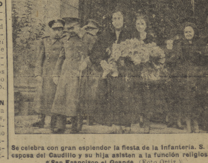
Se celebra con gran esplendor la fiesta de la Infantería. S. E. la esposa del Caudillo y su hija asisten a la función religiosa en San Francisco el Grande.