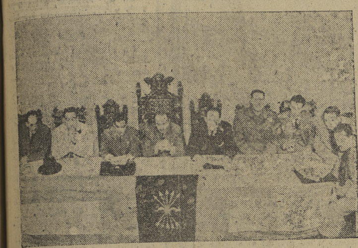
Tribuna presidencial de la Asamblea de la Cámara Oficial Sindical Agraria que se celebró ayer en el cine Córdón.