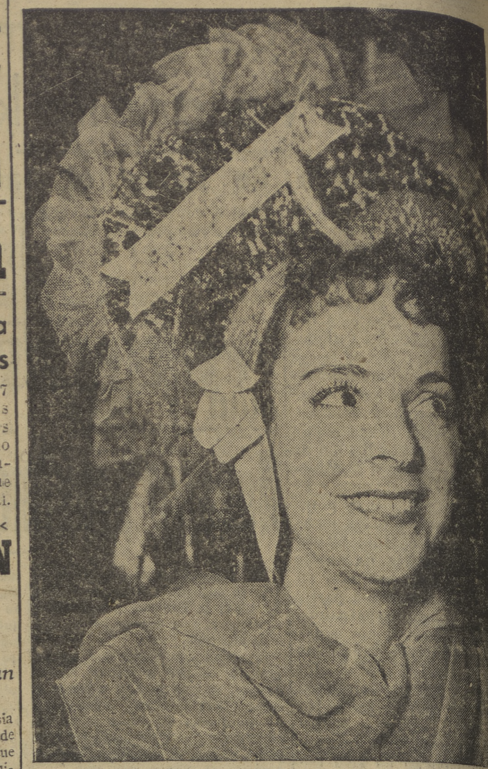
Las costureras del París de 1948 tuvieron ocasión, el día de la fiesta --25 de noviembre-- de exhibir sus originalidades en el difícil arte de hacer cofias que tengan un aire elegante y expresivo. Los parisinos quedaron asombrados de las gaitas creaciones presentadas por las herolinas de la aguja. El modelo que presenta la "foto" ha sido denominado irónicamente --por que también ellas tienen derecho a ironizar de vez en cuando con el genérico nombre de "El grito de la anolancia" --