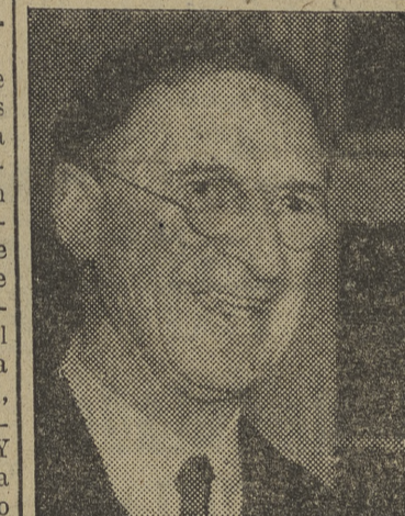
Edmundo De Valera, ex presidente de Irlanda y antiguo luchador por su total independencia

Mientras la discusión en los Comunes de la ley de nacionalización de las industrias del acero y la causa general contra la burocracia siguen ocupando metros cuadrados de papel impreso, apenas en un rincón se leen las pequeñas referencias de las reuniones celebradas estos días en París,