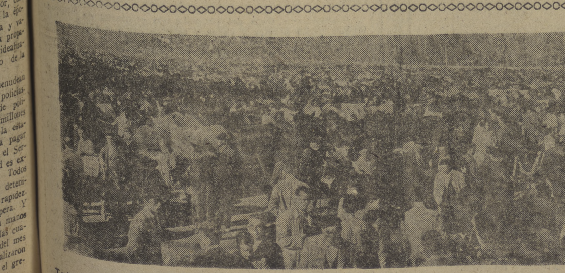
Todo el vari y multicolor paisaje de la feria queda recogido en este reportaje gráfico de Villafraanca. Gentes de toda España van y vienen entre las reoas de ganado. Hablan, discuten, "tra tan" y "median" en una constante actividad que resume toda la comercial y humano

LOS PANTANOS SIGUEN IGUAL MADRID, 11. — El 23 por ciento de agua de su capacidad actual conservan hoy los pantanos españoles. Su descenso ha sido inapreciable durante la última semana.