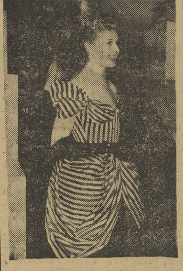
Sheila Sim, la actriz inglesa de cine, lucía este magnífico vestido de rayas azules y blancas a su llegada al Carlton Cinema, de Londres, para asistir al estreno de la película "El conejo de Indias", que se proyectó en función homenaje al Orfeón de Actores.

Y su belleza, como toda belleza auténtica, aumenta con el agua y la noche. Se esparcía la lluvia con afán y, Madrid, esmerilado, parece brillar satisfacción con la luz indecisa de las restricciones. Los guardias tienen un aspecto de invernales entre nieve, y los pasos de las muchachas cantan sobre el asfalto una canción húmeda y joven. Por una vez —sí, por una vez— dejemos a Madrid contemplar, bajo la lluvia, el paso de las muchachas de veinte años.