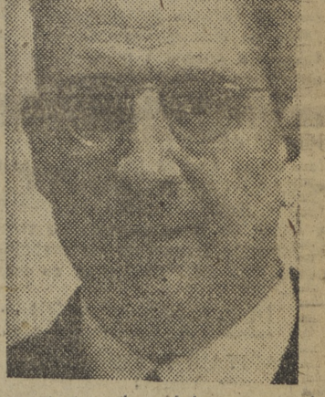
Brindo, señores, por la grandeza de nuestros dos países, caminando por sus respectivas sendas, hacia aquellos grandes objetivos.