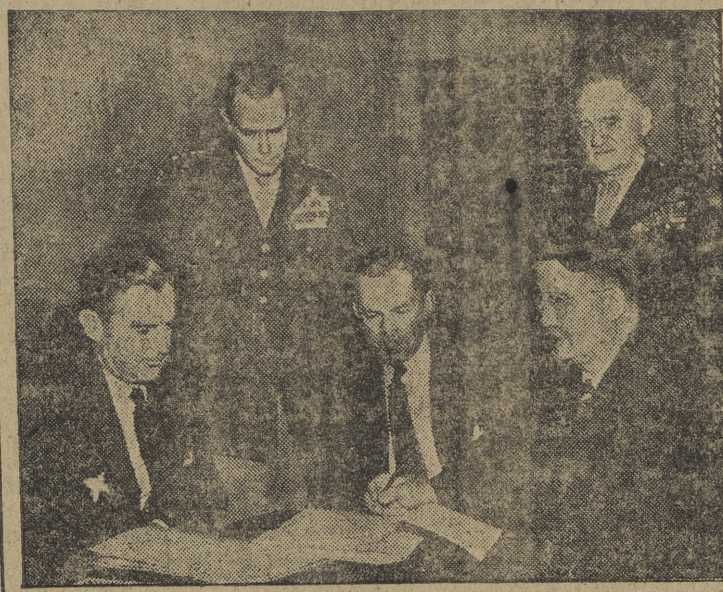
La "foto" recoge el momento de una reunión del Comité de Servicios Armados del Senado norteamericano, cuyo presidente, Mr. Gurney (x), ha visitado al jefe del Estado español.

Examen de Estado Cuarta relación de números de alumnos admitidos en el ejercicio escrito: 451 al 454, 457, 466, 469 al 471, 473, 475, 478, 480, 484, 488, 489, 492, 498, 502, 505, 506, 508 al 514, 517, 521, 523, 527, 528, 534, 536, 540 al 543, 545 al 547, 549, 550, 552, 553, 555 al 561, 564 al 566, 568 al 570, 580, 581, 584, 589, 591, 600, 602, 603, 605, 606, 608, 613, 620, 623 al 630, 632, 634, 635, 640, 642 al 645, 647 al 651, 656 al 658, 660 al 663, 666, 668, 670, 671, 673, 675, 676, 682, 685 al 689, 693 al 695, 698 al 700, 702, 703, 705 al 709, 716 al 718, 724, 726, 730, 731, 733 al 735, 738 al 740, 743 y 750.