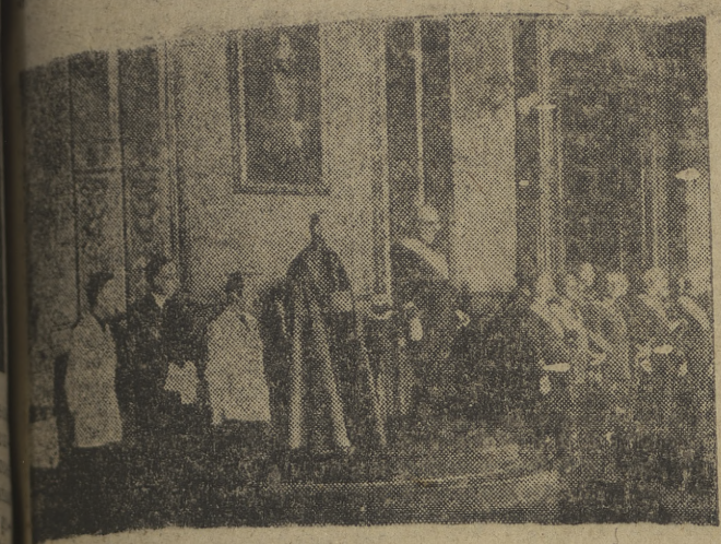
El teniente general don Juan Yagüe Blanco, acompañado de todas las autoridades civiles y militares de la ciudad, preside la recepción en el palacio de Capitanía.

Se celebró esta mañana en el palacio de Capitanía de Burgos una solemne recepción en honor del día del Caudillo. El acto fue presidido por el teniente general don Juan Yagüe Blanco, acompañado de todas las autoridades civiles y militares de la ciudad. En su discurso, el teniente general elogió el espíritu de unidad y disciplina que caracteriza al régimen franquista, y expresó su confianza en el futuro de España bajo el liderazgo del Caudillo. La recepción estuvo acompañada de una banda de música que interpretó el Himno Nacional y el Himno de la Legión. El acto concluyó con un momento de silencio en memoria de los caídos por la causa nacional.