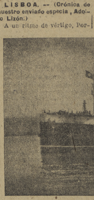
Un barco mercante. El espectáculo que hoy el escudo se cotiza más que a peseta, radica ahí.

Su flota mercante aumenta ahora más en una semana que antes en cinco años