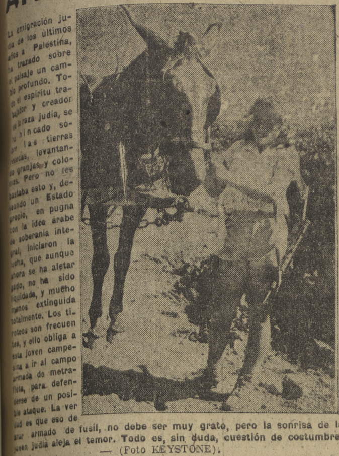
La inauguración de la primera fase de las obras que realiza la Junta Técnica en Cerezo de Riotiron, que serán hoy bendecidas e inauguradas.