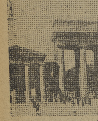
He aquí la puerta de Brademburgo. Hoy su estructura está demurrada por las bombas y los cañonazos, pero a pesar de todo sigue siendo el centro de la Europa que no quiere morir. Bajo estas columnas convergen las ambiciones de los ocupantes de Alemania. Los unos esperan pasarlas y los otros se conforman con resistir a su sombra. La puerta de Brademburgo es un cruce de civilizaciones y, aun rota, señala la permanencia de Europa.

acuerdo fina con ella y buscan ese acuerdo por todos los medios. Como además no se nota que hagan nada para quitarse a de ante o para prepararse ante la ruptura familiar, tememos que no están gan-