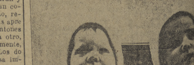
He aquí un par de traidores! Aunque parezca mentira, esta pareja de ciudadanos soviéticos son elementos de cuidado y peligrosos para la supervivencia de régimen de Stalin. Así, tan pequeños y tan cometido el espeluznante y terrible crimen de quedarse en Noruega en lugar de regresar a Moscú a pasar frío y peripetias. Este incluye de golpe en la lista de los enemigos del régimen soviético persigue la G. P. U. como alimañas a través de todo el mundo. Los súbditos del Tio Sam; pero ahora sale el tío Pepe y dice que se le quitan los niños, pero ahora sale un artículo en el Código Penal que afirma la nacionalidad rusa de los tales, por ende en Noruega los Samarin Tomjone, que es quien, al refugiarse en Noruega, se ha metido en este lío, del que seguramente no entenderá la libra, por fortuna para ellos.

"Gilda" piensa volver a España más adelante. Días pasados circuló el rumor de que habría de venir contratada para actuar por una cifra casi astronómica. Tal vez sea cierto y en el otoño sea más asquible y explícita. Como es sabido, Rita Cansinos Hayworth nació en la calle madrileña del Olivar de Cádiz.