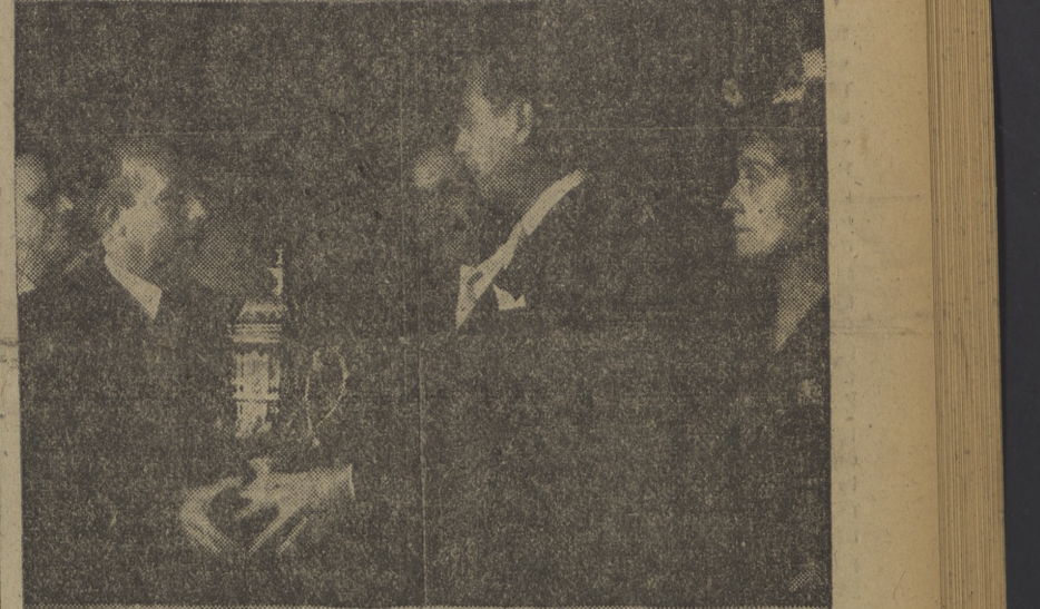
Con un éxito extraordinario se ha disputado en el hipódromo de La Zarzuela la Copa "La Argentina". En la espectacular carrera resultó ganador el caballo "Lord Oliver", montado por Gómez. El embajador de la nación hermana, Dr. Radio, hace entrega del magnífico trofeo al propietario del caballo vencedor. (Foto ORTIZ).