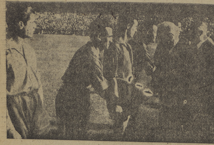
El presidente de la F. I. F. A., Mr. Rimet, saluda a los jugadores momentos antes de comenzar el encuentro.