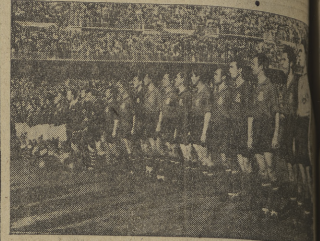
He aquí a los dos equipos, alineados, ante la tribuna de honor.