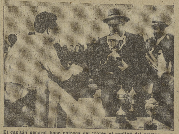
El capitán general hace entrega del trofeo al capitán del primer equipo clasificado.

En la mañana del domingo asistió también numeroso público al partido de hockey. Jugaron el Junior, de Madrid, y el Español, de La Coruña.