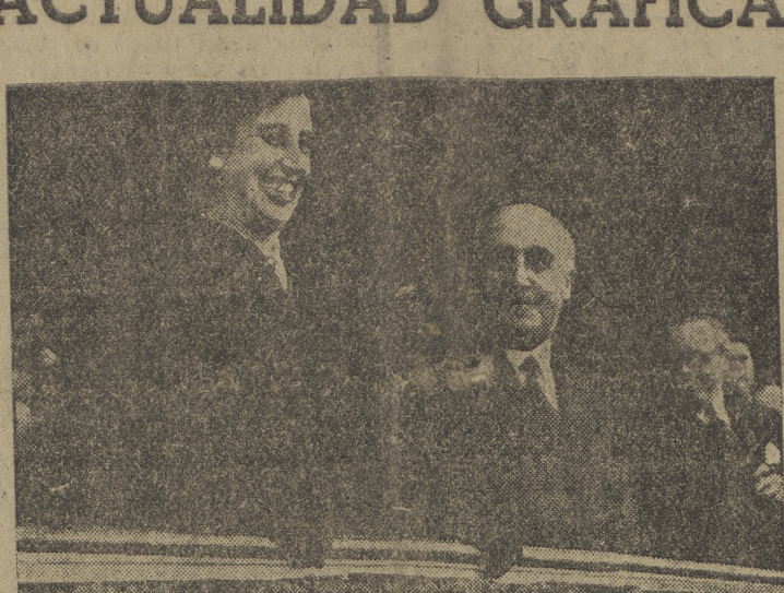
S. E. el Jefe del Estado, al llegar a Chamartín, es aclamado por el público, que le vitorea entusiastamente.

El ministro de Educación Nacional, señor Ibáñez Martín, recibió en su despacho oficial a los periodistas, a los que amplió la referencia del Consejo en los términos siguientes: