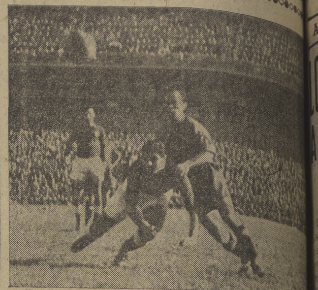
El primer gol de España.

SPRINTER Por necesidad de espacio dada la importancia y extensión de nuestra información deportiva, nos vemos obligados a trasladar en el presente número la sección "Punto de mundo", que encontrará el lector en tercera página.