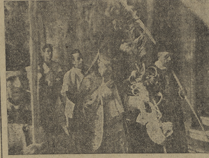
El excelentísimo señor arzobispo, durante la procesión de las palmas.