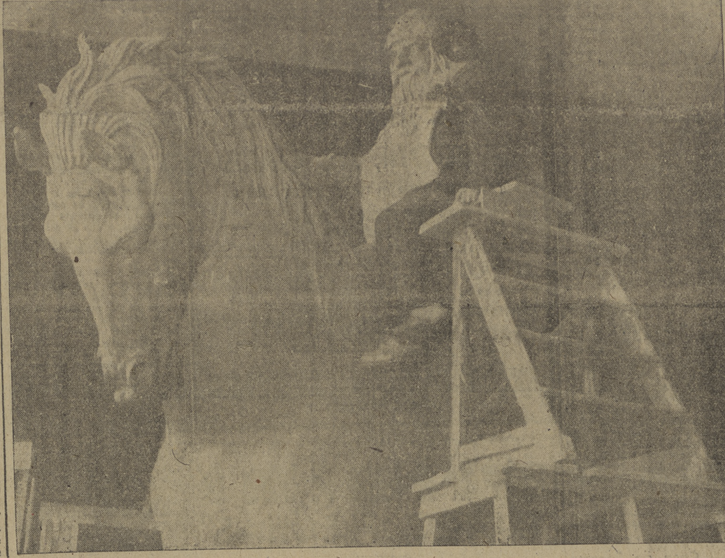
Por primera vez, y en una exclusiva de nuestro redactor gráfico, Villafraña, presentamos a nuestros lectores una fotografía de la grandiosa escultura del CID CAMPEADOR, que se halla modelando el notable artista JUAN CRISTOBAL, por encargo del Excmo. Ayuntamiento de nuestra ciudad, para el monumento al insigne guerrero burgalés. Ofrece como las primicias de esta obra, que hasta la fecha nadie había podido fotografiar, según la norma de ese artista.