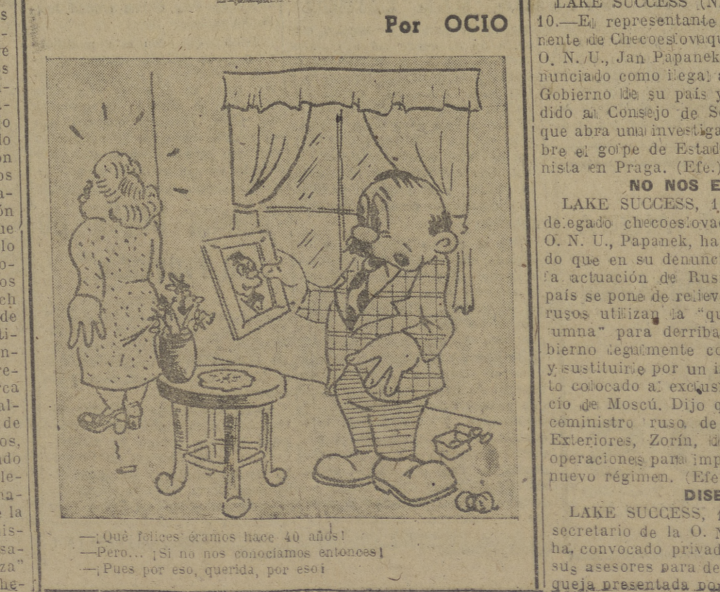
— ¿Qué felices éramos hace 40 años! — Pero... ¡si no nos conocíamos entonces! — Pues por eso, querida, por eso!