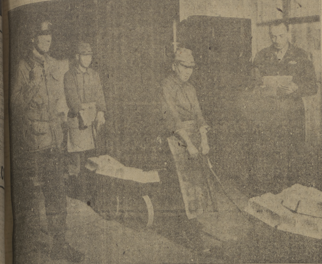
Las piezas norteamericanas de ocupación del Japon se han adecuado parcialmente de la fábrica de monedas de Osaka, al objeto de que en ella se fundan los metales preciosos destinados a las reparaciones de guerra. Una parte pequeña de dicha fábrica la utilizan aun los japoneses para la acuñacion de moneda. En el momento de ser llevados para su almacenaje algunos lingotes, mientras un oficial norteamericano controla la operacion.