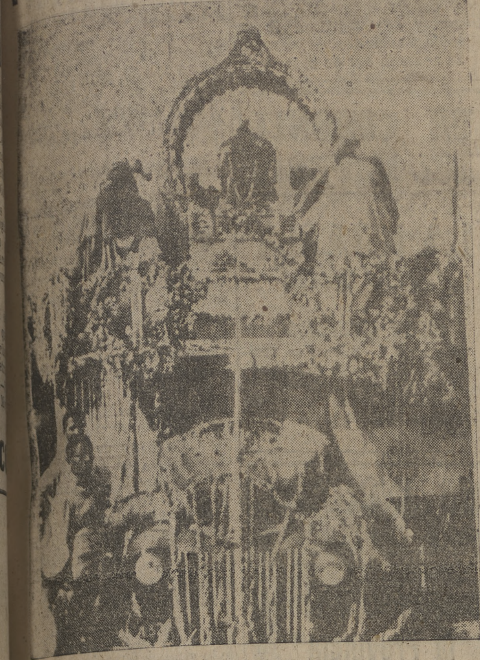
En esta corteza, adornada con banderas, guirnaldas y flores, las cenizas del mahatma Gandhi fueron conducidas procesionalmente desde Nueva Delhi hasta la confluencia de los ríos Jumna y Ganges, donde fueron arrojadas, siguiendo los ritos religiosos hindúes.