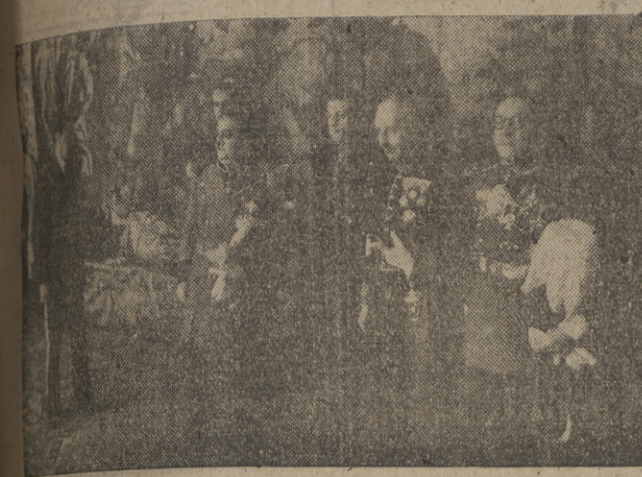
El nuevo ministro, Barón de Guariglia, llega a palacio para su presentación como enviado de la Orden de Malta. — (Foto ORTIZ).