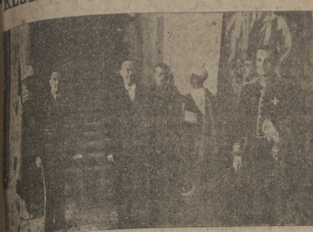
El nuevo ministro de Bolivia, al salir de presentar sus cartas credenciales al Caudillo. — (Foto ORTIZ).