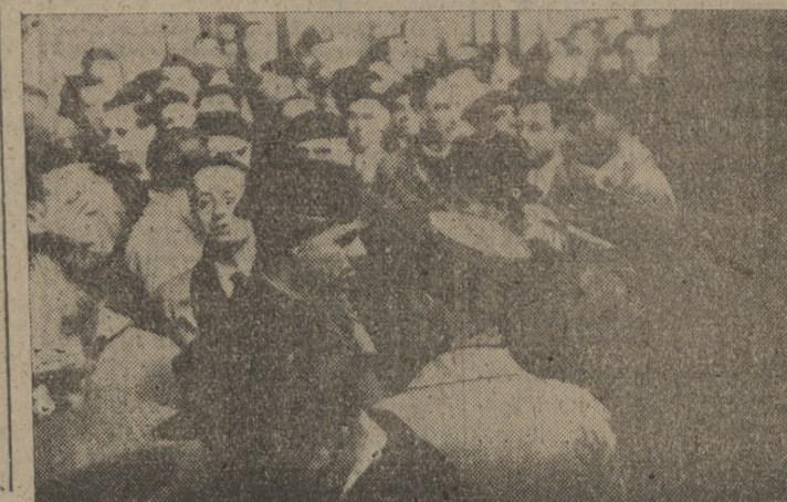
Gendarmes franceses en la estación de Irún, conversando con los españoles.