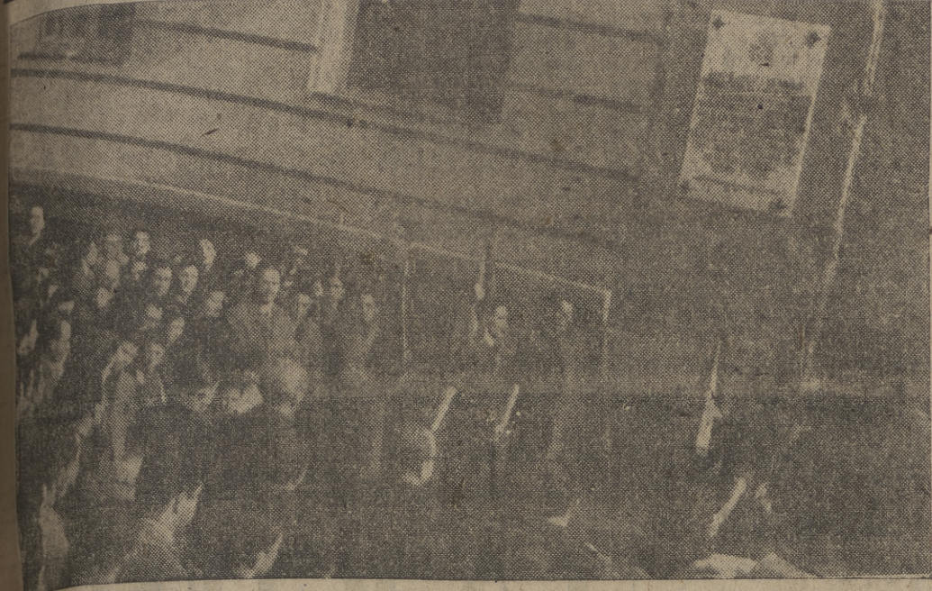
Ofrenda del "Día del Estudiante Caído" se ha celebrado, como todos los años, la ofrenda de las cinco flores en el lugar donde fue asesinado el primer mártir del S. E. U., Matías Montero, en la calle de Víctor Pradera. — (Foto ORTIZ).