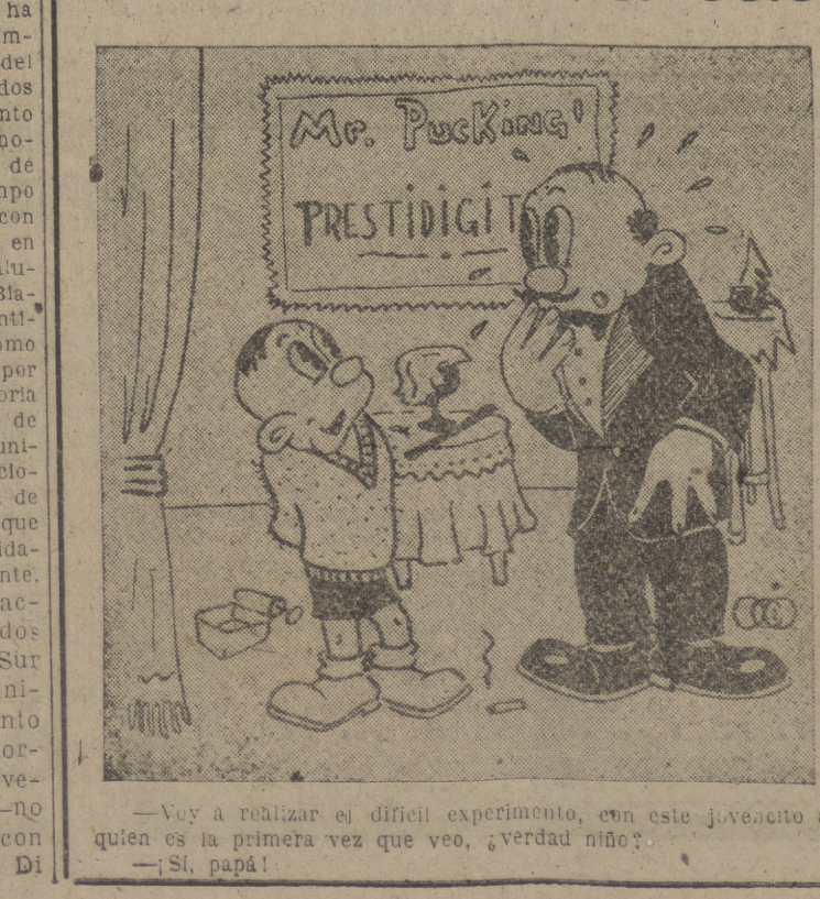
—Voy a realizar el difícil experimento, en este momento a quien es la primera vez que veo, ¿verdad niño? — ¡Sí, papá!