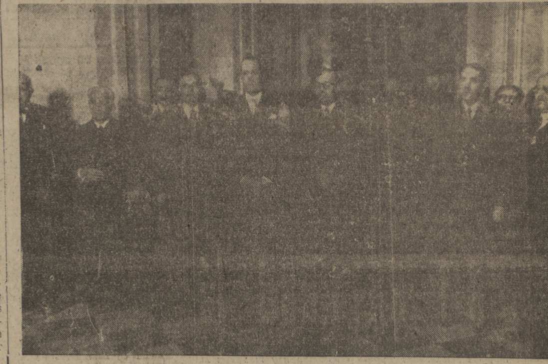
En la Real Sociedad Geográfica pronunció una conferencia el embajador de la República Argentina, señor Radio. Presidieron el acto el ministro de Educación Nacional, el obispo de Madrid, doctor Elío; el jefe de la misión argentina, general Avato, y otras personalidades.

—¿Qué ocurre, Filomena? — ¡¡Qué desgracia, señorita!! Como habían cortado el agua, he bajado a la calle a llenar el cubo en cualquiera de esos charcos de la calzada... Y... ¡¡Se me ha ido al fondo...!!