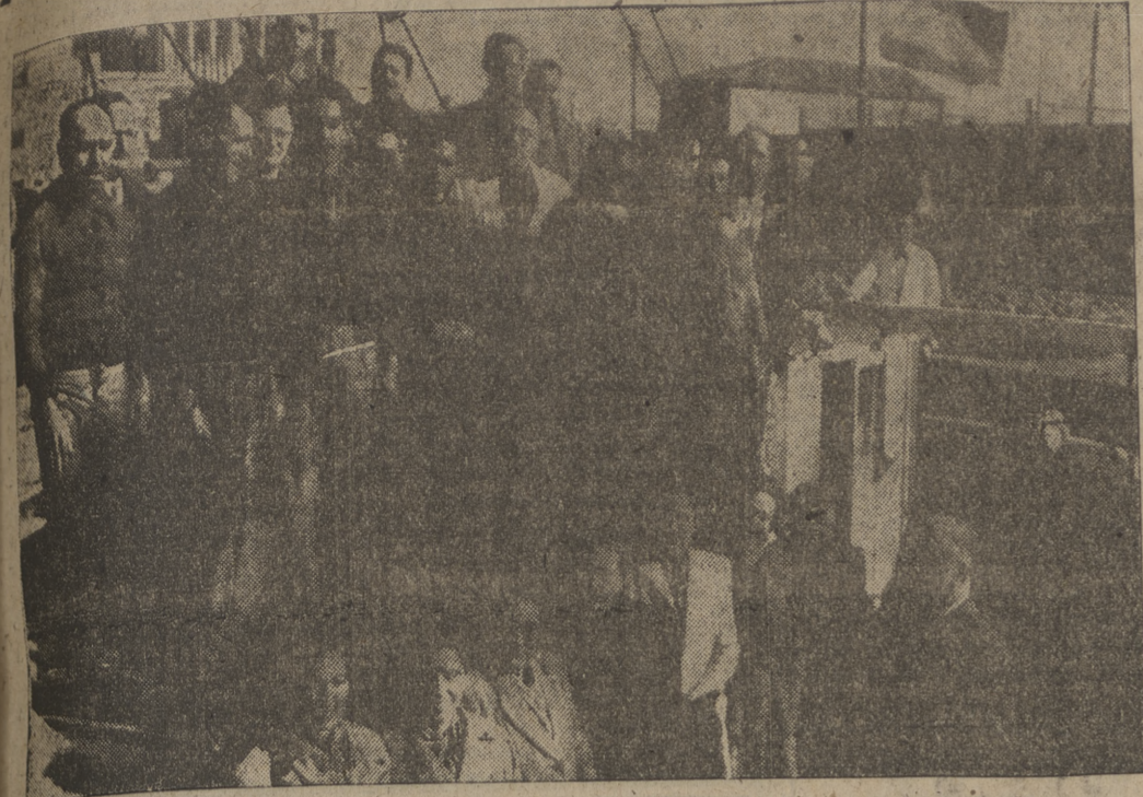
La tripulación mallorquina del velero "Cala Contesa", en el acto de entronización de la Virgen del Garmen en la embarcación. Emotivo acto al que concurrió una representación de Acción Católica Femenina de Palma.