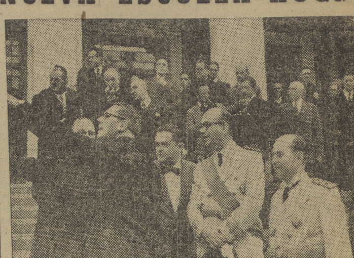
Los asistentes a la bendición e inauguración del Hogar de San Isidoro, para huérfanos de periodistas, abandonan el edificio después del acto.