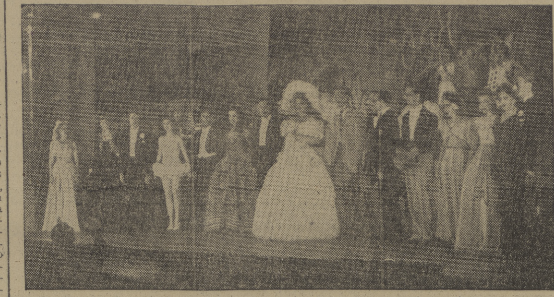
La compañía del "Scala", recibe al final de la representación los entusiastas aplausos del público.