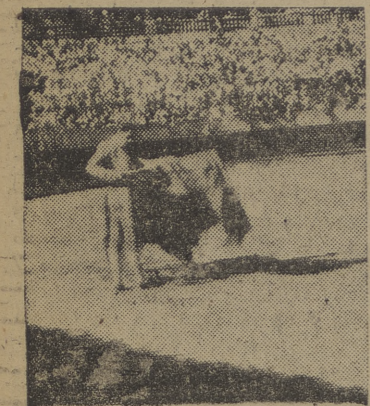
Por falta de espacio nos limitamos a dar hoy la reseña de la corrida de Beneficencia de Madrid, dejando para mañana la anunciada crónica de nuestro enviado especial "Juanito Calreica".

Su presencia fue acogida con grandes ovaciones