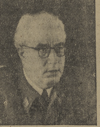
DISCURSO DEL CAPITAN GENERAL SEÑOR YAGÜE

Al discurso del primer jefe de la Agrupación, contesta el capitán general don Juan Yagüe, "agradeciéndome frases de afecto que le ha dirigido."