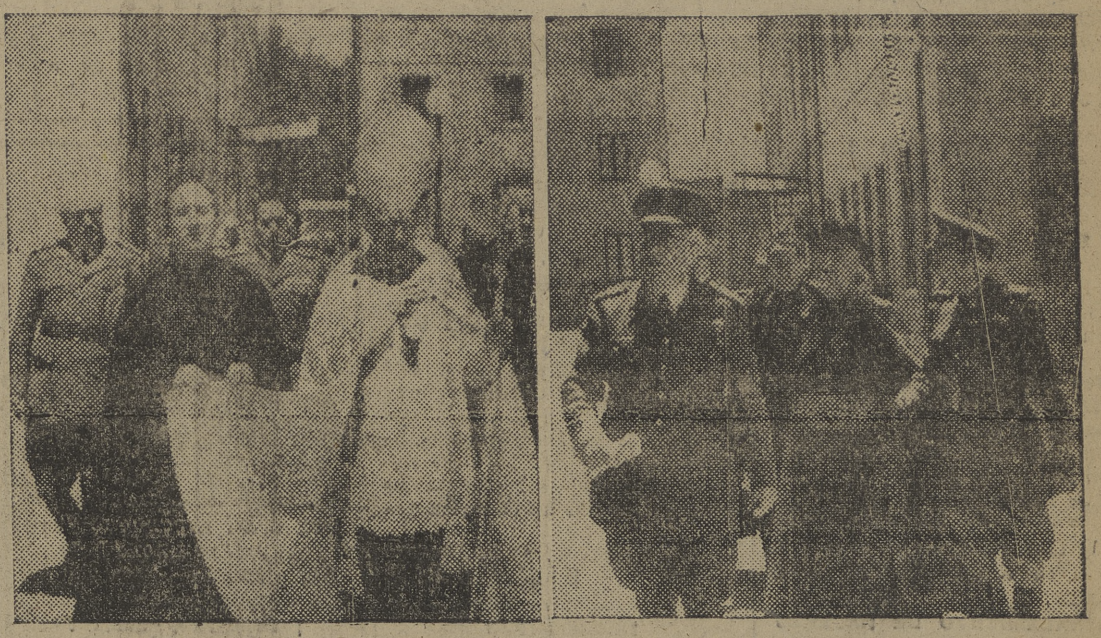
Dos momentos gráficos de la inauguración de ayer: el excelentísimo señor arzobispo, va a proceder a la bendición de los edificios. — El capitán general, don Juan Yagüe, a quien acompaña el prelado de la diócesis, inspecciona los nuevos edificios