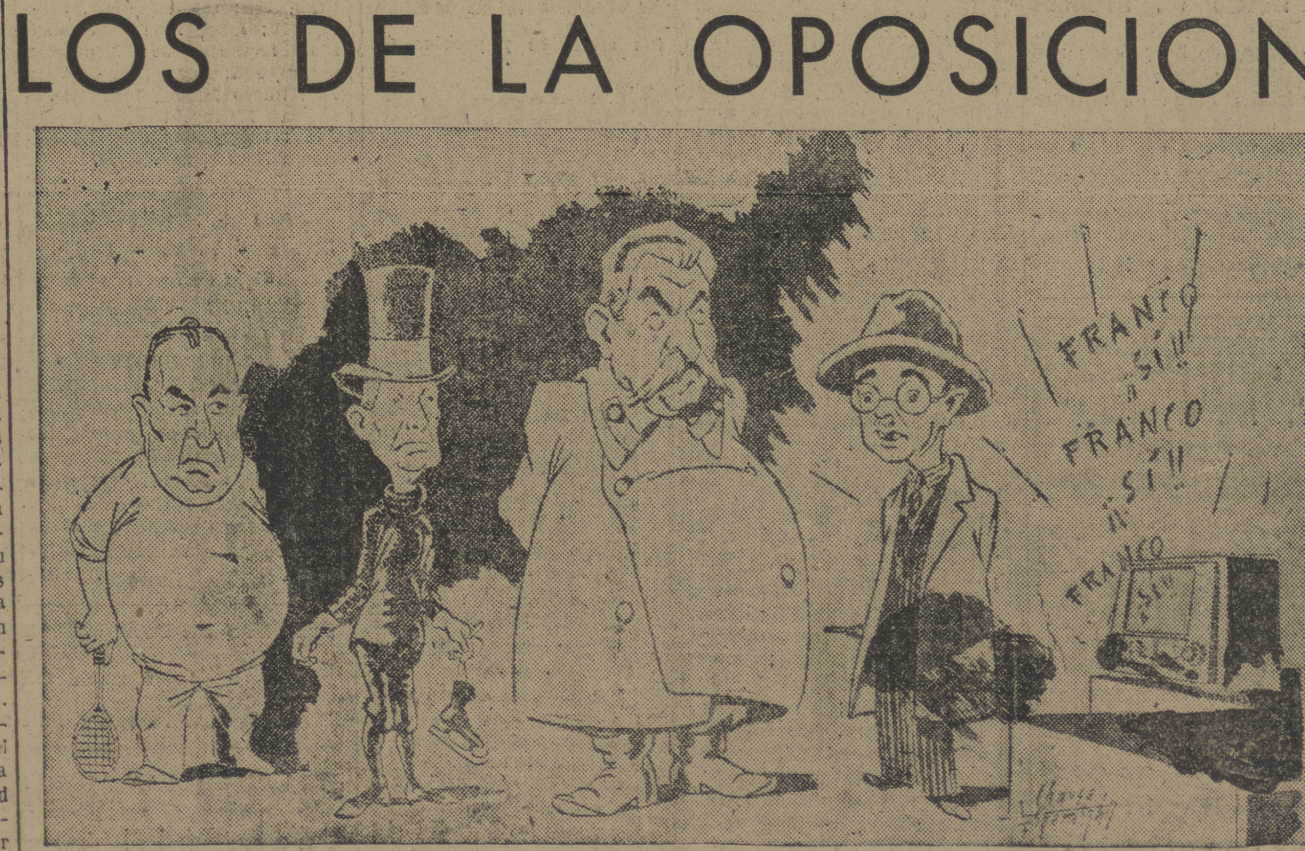
La unanimidad con que la opinión pública ha demostrado estar conforme a la aprobación del referéndum, tenía—¿cómo no?— desde el extranjero venían predicando el abstencionismo los informadores de las agencias extranjeras dan cuenta de que se pasaron el domingo pendientes de la "radio". Se trata de un "trágico" genia que ha traducido a la caricatura el admirable dibujante Chausa