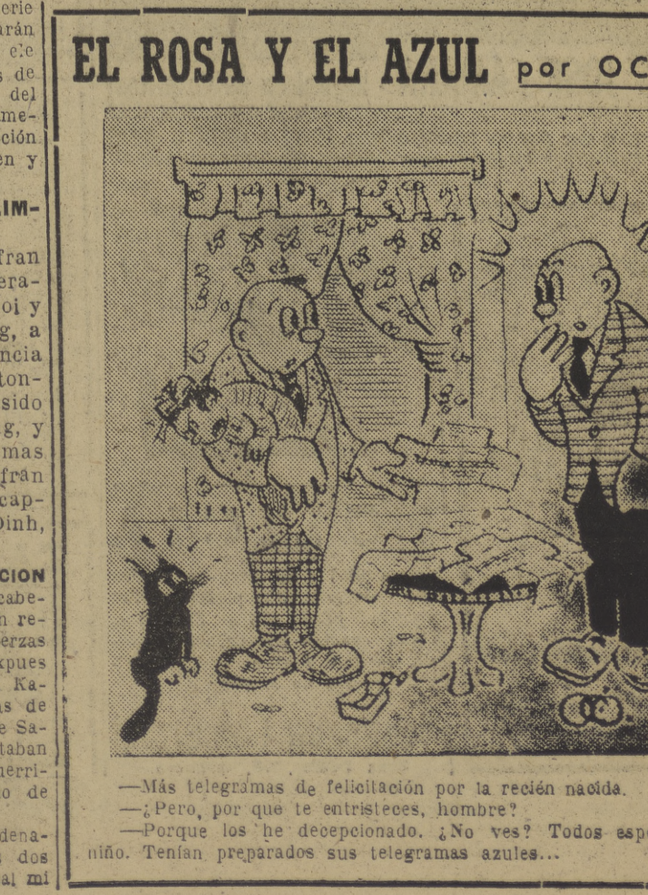
Más telegramas de felicitación por la recién nacida. Pero, por que te entristeces, hombre? Porque los he decepcionado. No ves? Todos esperaban niño. Tenían preparados sus telegramas azules...