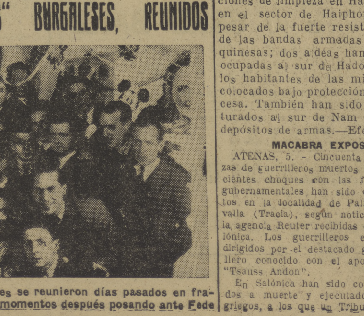
Los operadores burgaleses se reunieron días pasados en fraternal ágape. Melos aquí momentos después posando ante Fede