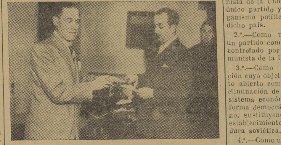
Momento de la entrega del artístico bastón de mando al Excmo. señor gobernador civil. La entrega la efectúa el secretario de la Diputación montañesa.