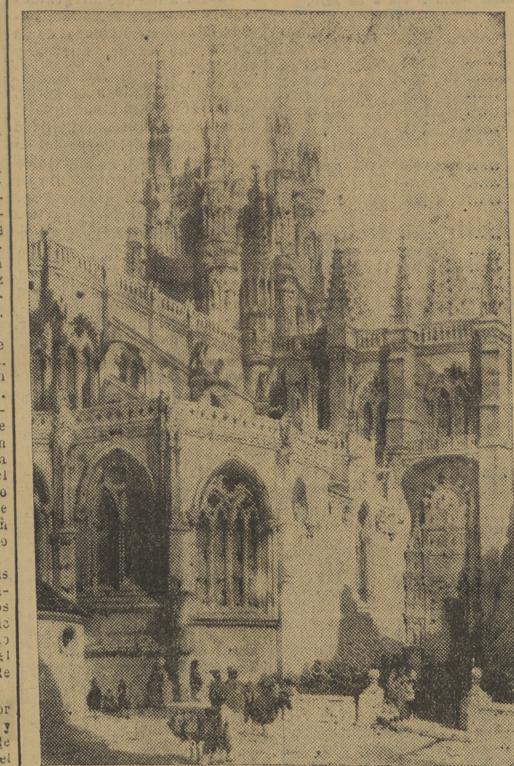
Vista de la Colegiata de Covarrubias