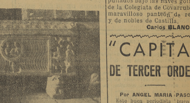
Capitulo de la Colegiata de Covarrubias