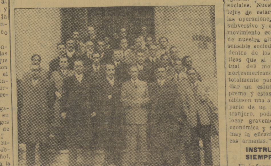
El Excmo. señor gobernador civil y jefe provincial del Movimiento, momentos después de la entrega del bastón de mando, rodeado de todos sus compañeros de la Diputación santanderina, que vinieron a acompañarle en la memorable fecha.