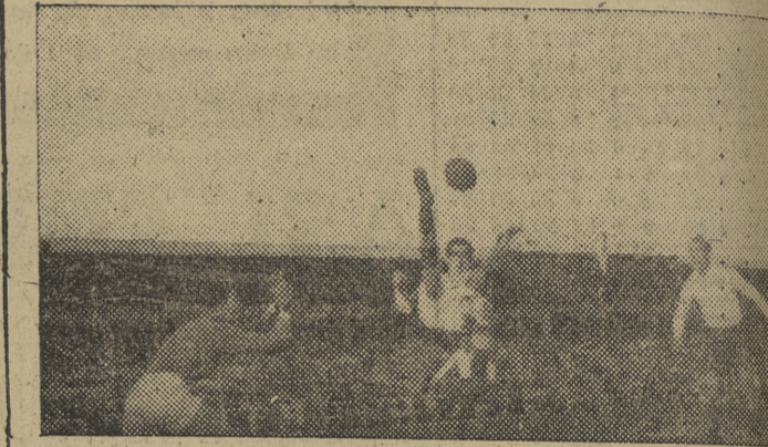
Cuando ya se creía batido al portero catalán, el defensa, en una jugada espectacular y maravillosa, salva el tanto que parecía irremediable.