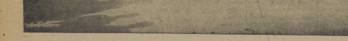
Gran acontecimiento deportivo de nuestra ciudad el domingo pasado. La carrera a campo través organizada por el Frente de Juventudes fué un éxito rotundo, en la que participaron más de sesenta corredores. He los aquí momentos antes de comenzar la prueba.