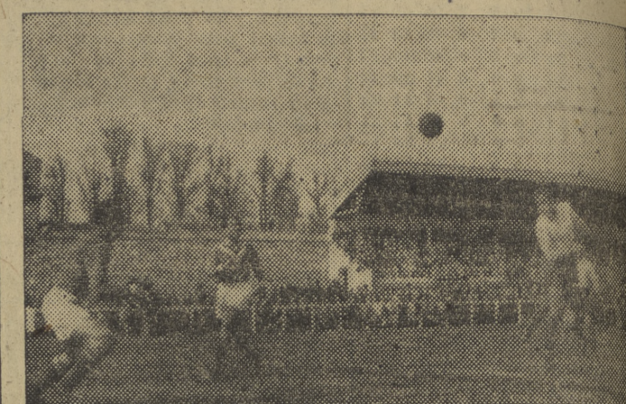
Un gran cabezazo de Malón que... no quiso entrar en la red.